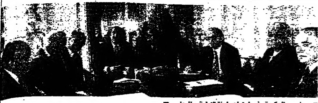
رئيس الحكومة في اجتماع لجنة الإدارة والمعدل